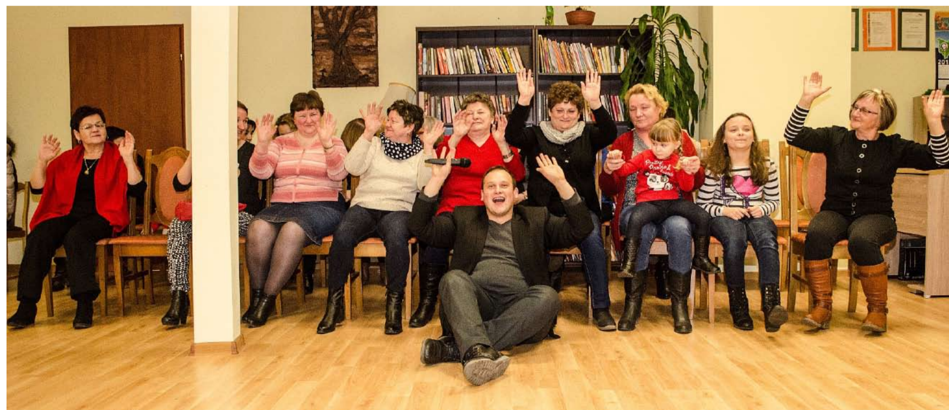
Publiczność bawiła się znakomicie na pokazie mody w Kurnosie Drugim