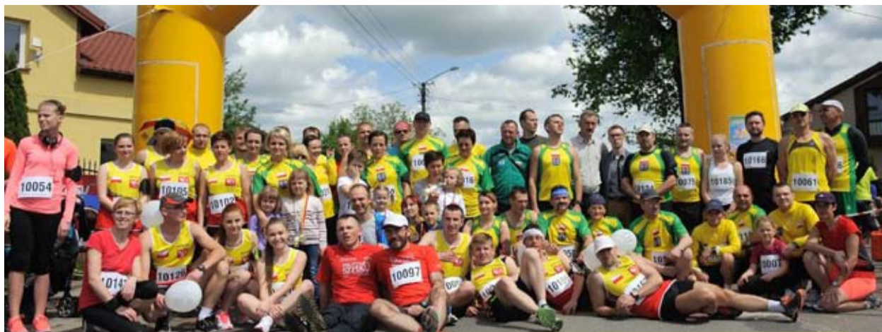
Uczestnicy I Gminnej Zadyszki tuż przed startem