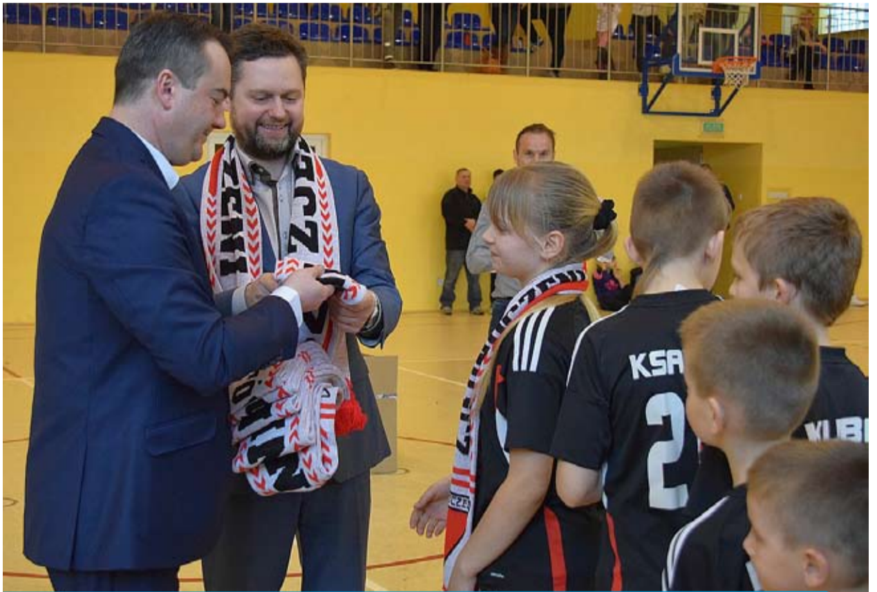
Każdy zawodnik otrzymał pamiątkowy upominek

rocznika 2004 i młodszych. Zawody Bełchatów. Każdy zespół zagrał po odbyły się w na sali gimnastycznej cztery spotkania, systemem „każdy w Łękawie, gdzie organizatorem, z każdym”. W turnieju nie prowadziła zarazem gospodarzem była adzono klasyfikacji drużyn, więc drużyna Zjednoczonych Gmina wszyscy byli zwycięzcami. Każda