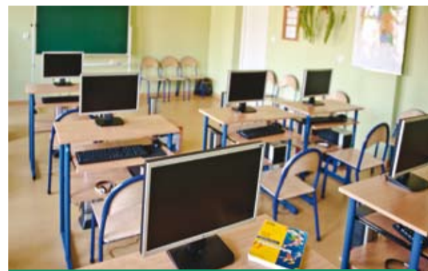
Szkolna pracownia komputerowa

Bełchatów - Wszyscy mamy wpływ na wysokość dochodów gminnego budżetu, które wydatkowane są przede wszystkim na rozwój, tak aby wszystkim mieszkańcom żyło się lepiej i wygodniej.