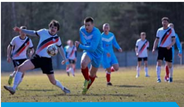
Zjednoczeni Gmina Bełchatów od dwóch zwycięstw zaczęli rundę rewanżową

Po raz pierwszy w historii gminy Bełchatów po sukcesie w zawodach międzypowiatowych