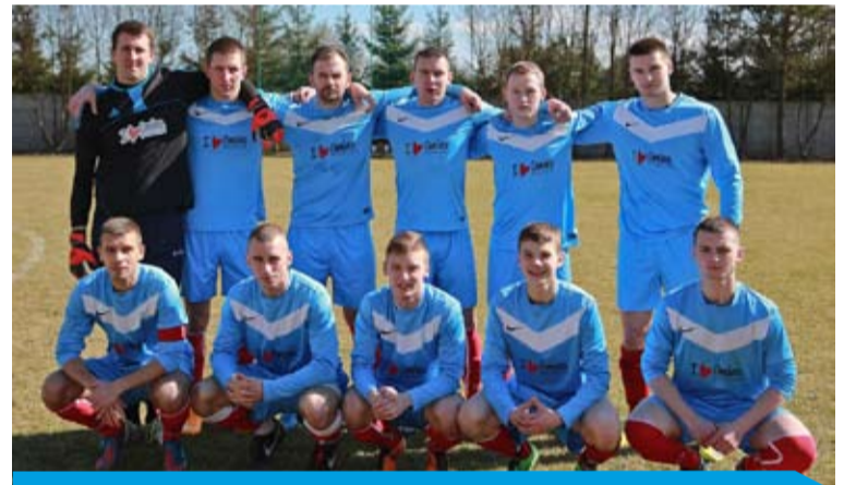
Zjednoczeni Gmina Bełchatów