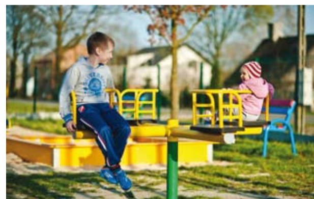
Plac zabaw w Kałdunach

rozbudowę infrastruktury społecznej. Gmina przeprowadza modernizacje i remonty placówek oświatowych i domów kultury. Poszerza ofertę edukacyjną poprzez tworzenie