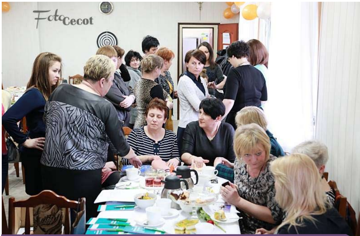
„Dzień Kobiet ze zdrowiem i urodą” zgromadził ponad 50 pań, które mogły poddać się badaniu mammograficznemu