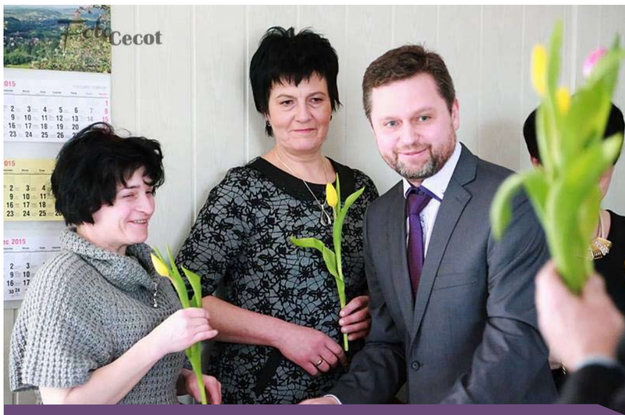
Dzień Kobiet w Zawadach