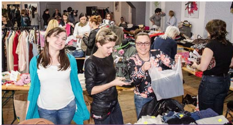
Szafing w GCK w Zdieszulice Dolne

czytelników. Największe zainteresowanie wśród czytelników jest u dzieci i młodzieży. Nasza placówka dzięki dofinansowaniu z Biblioteki Narodowej oraz dzięki wkładowi własnemu zakupiła nowe książki - głównie są to pozycje dla