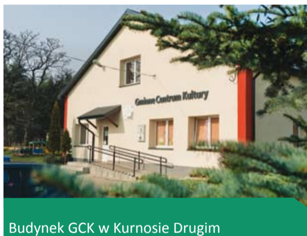
Budynek GCK w Kurnosie Drugim

Zgłoszenie nowego miejsca zamieszkania nie wymaga zmiany zameldowania, wymiany doku-