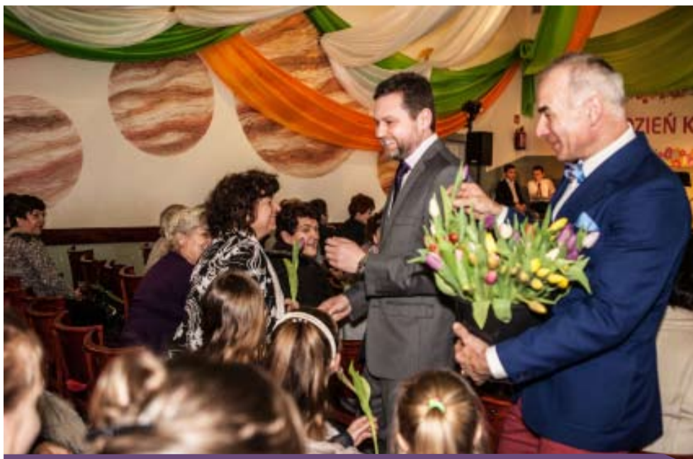
Ósmego marca humor dopisywał wszystkim

- 11 lutego Panie z miejscowości Augustynów w ramach spotkań z cyklu „Kobiety Wtorki” tworzyły i malowały piękne wianki z papierowej wikliny. 20 lutego odbyły się pierwsze i co tygodniowo cykliczne warsztaty ceramiczne, na których dzieci i młodzież tworzą swoje prace