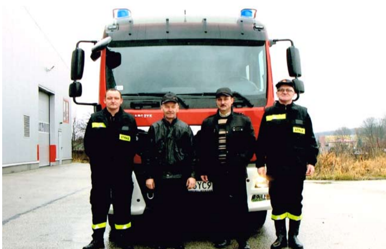
Druhowie z OSP Huta