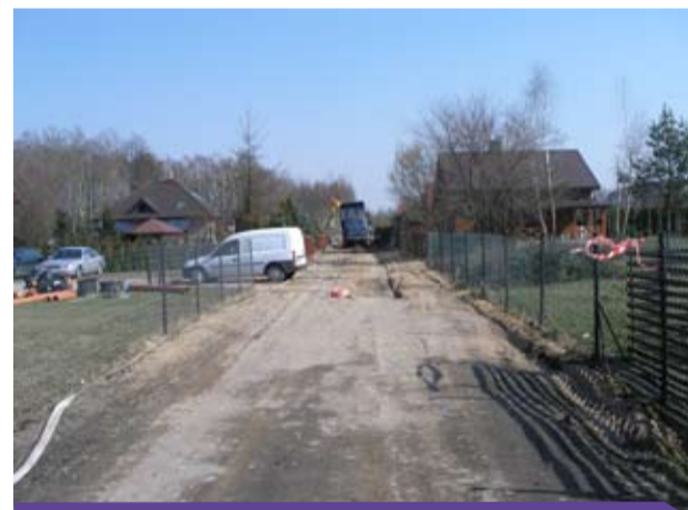
W Zawadach prace wciąż trwają

5) „Opracowanie dokumentacji projektowej - Budowa sieci wodociągowej Myszaki - Dobrzelów” - ok. 2400m.;