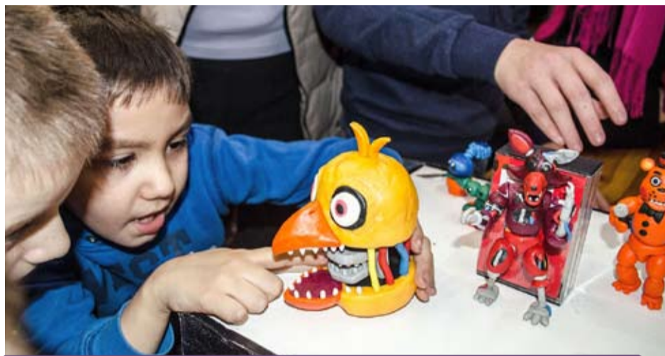
Dzieci zachwycały się figurkami wykonanymi przez młodego artystę

kańcami Gminy (40 osób) na „Jesus Christ Superstar” do Teatru Muzycznego w Łodzi.