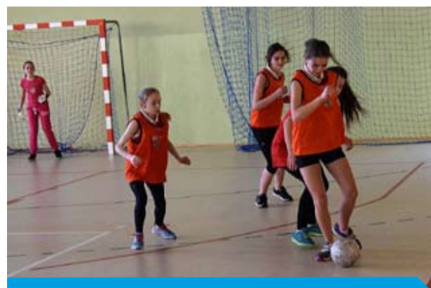
Mistrzostwa Gminy Bełchatów Szkół Podstawowych w Halowej Piłce Nożnej