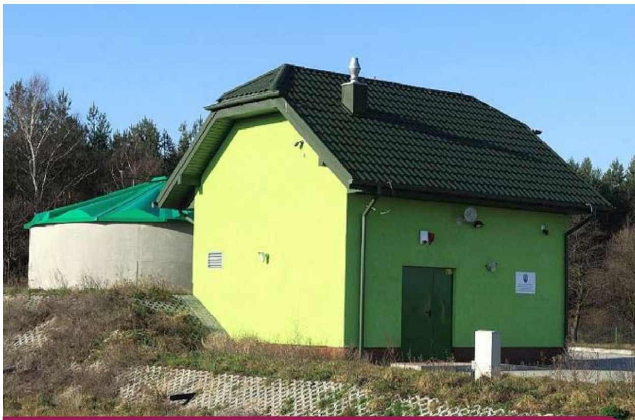
Oczyszczalnia ścieków w Łękawie

Zgodnie z Uchwałą nr XLVII/393/2014 Rady Gminy Bełchatów z dnia 17 marca 2014 r. w sprawie przyjęcia Programu wsparcia budowy podłączeń budynków do zbiorczego systemu kanalizacyjnego na terenie Gminy Bełchatów w latach 2014 – 2015 wraz z Regulaminem udzielenia dotacji celowej na dofinansowanie kosztów inwestycji z zakresu budowy podłączeń budynków do zbiorczego systemu kanalizacyjnego i Zarządzeniem Nr 33/2014 Wójta Gminy Bełchatów z dnia 11 kwietnia 2014 r. w sprawie przyjęcia wzorów dokumentów dla Programu wsparcia budowy podłączeń budynków do zbiorczego systemu kanalizacyjnego na terenie Gminy Bełchatów w latach 2014 – 2015 wraz z Regulaminem udzielenia dotacji celowej na dofinansowanie kosztów inwestycji z zakresu budowy podłączeń budynków do zbiorczego systemu kanalizacyjnego: