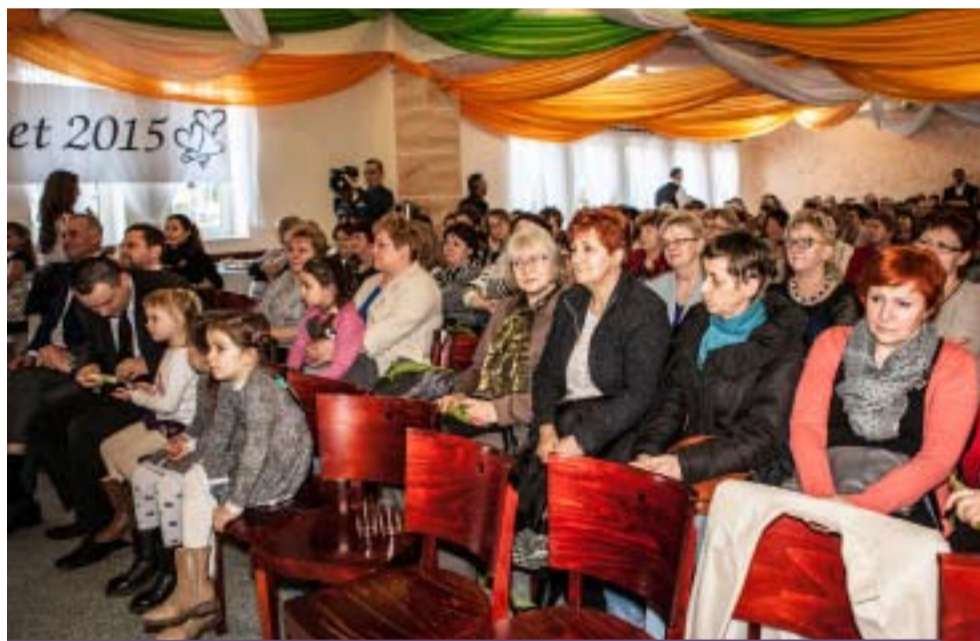
W tym roku obchody Gminnego Dnia Kobiet odbyły się w Zawadowie

- 8 marca w OSP w Zawadowie zorganizowaliśmy Gminny Dzień Kobiet,