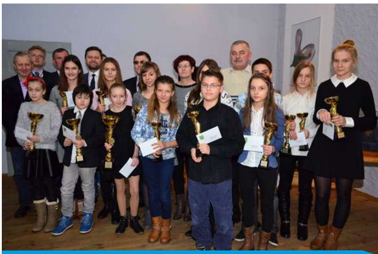
Laureaci XVII Plebiscytu Sportowego Gminy Bełchatów