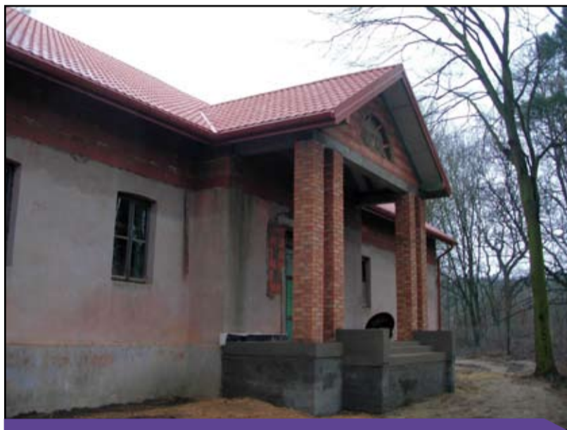
Budowa świetlicy środowiskowej w Wielopolu

1) Rozbudowa kanalizacji sanitarnej w m-ci Zawady (dz. 24/13, 22, obręb 39 Zawady) – etap V. Zakres prac obejmuje: budowę rurociągu i studni kanalizacji sanitarnej fi 200 – 154m., fi 160 – 52m., montaż pompowni ścieków śr. - 1,40m., budowę rozdzielni elektrycznej. Koszt inwestycji: 209 970,03