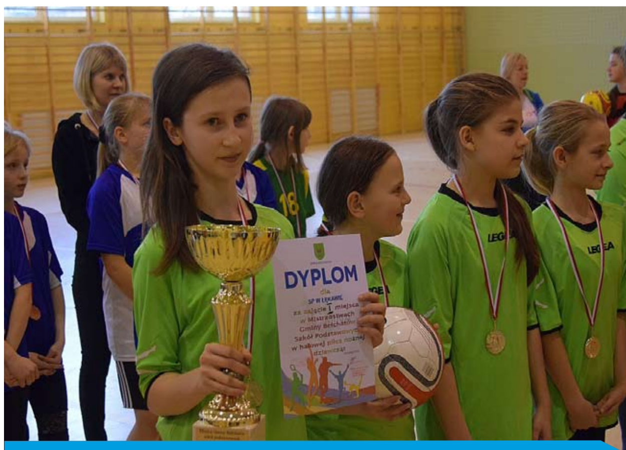
I miejsce w Mistrzostwach Gminy Bełchatów SP w Halowej Piłce Nożnej Dziewcząt zajęła reprezentacja Szkoły Podstawowej w Łękawie