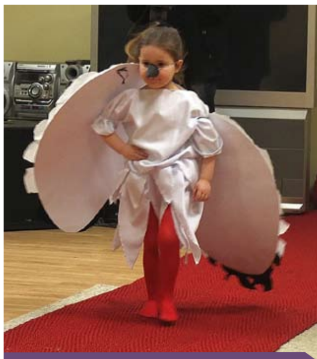
Pokaz mody dziecięcej w Kurnosie Drugim