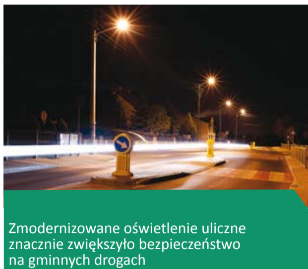
Zmodernizowane oświetlenie uliczne znacznie zwiększyło bezpieczeństwo na gminnych drogach

Dla Gminy podstawą dochodów własnych jest udział w podatku płaconym przez osoby fizyczne, czyli tzw. PIT, który w 2014 roku stanowił 24% wykonanych dochodów, co dało kwotę 8.765.718,58 złotych.