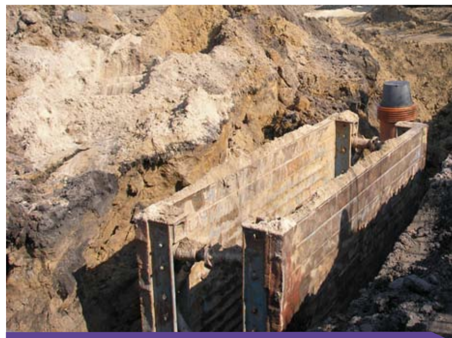
Rozbudowa kanalizacji sanitarnej w Zawadach – etap IV

2) Rozbudowa kanalizacji sanitarnej w m-ci Zawady (dz. 24/13, 22, obręb 39 Zawady) – etap V. Zakres prac obejmuje: budowę rurociągu i studni kanalizacji sanitarnej fi 200 – 154m., fi 160 – 52m., montaż pompowni ścieków śr. - 1,40m., budowę rozdzielni elektrycznej. Koszt inwestycji: 209 970,03