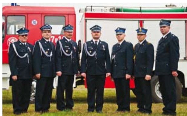
Gminna Straż jest stale wyposażana w nowoczesny sprzęt

B PIT 36, 37 itd.) wskaże jako swój adres zamieszkania zamiast Gminy Bełchatów, w której faktycznie mieszka – gminę (miasto), w której wprawdzie jest zameldowany, ale tam nie zamieszkuje – pieniądze te trafią do kasy gminy (miasta) właściwej ze względu na miejsce zameldowania.