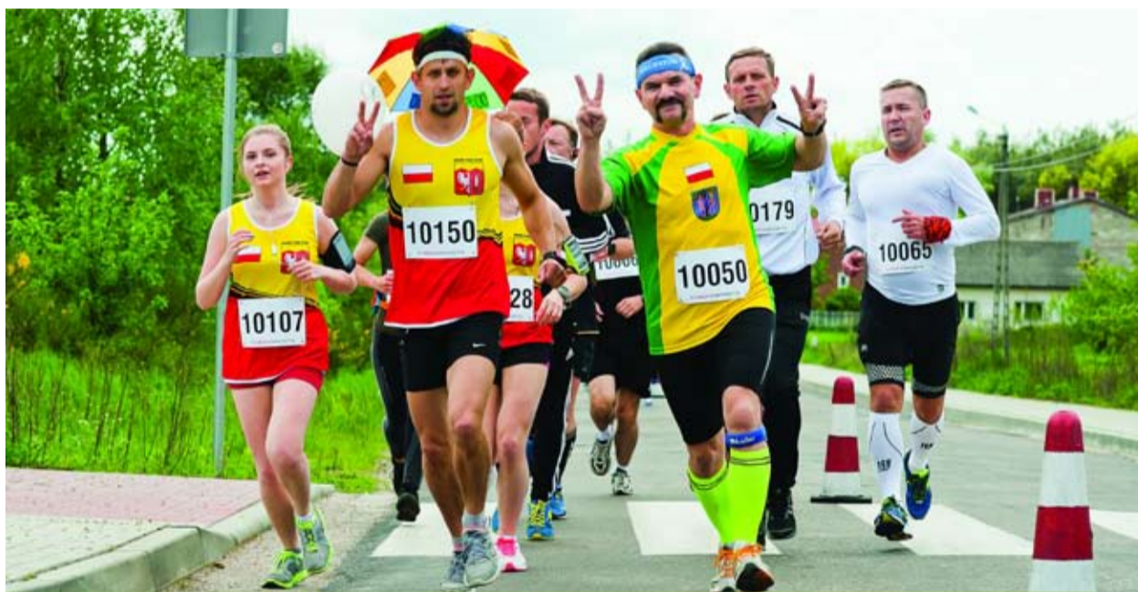
Pogoda i atmosfera podczas biegu były znakomite!