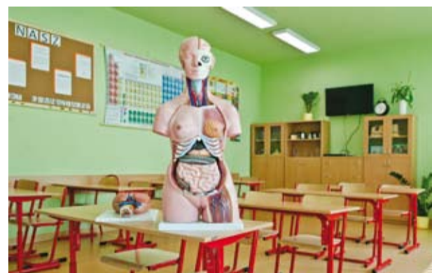
Nowoczesna pracownia biologiczna

Samorząd Gminy Bełchatów dokłada wszelkich starań, aby sukcesywnie i efektywnie realizować te założenia. Budowane są drogi i chodniki, rozbudowywana jest sieć kanalizacyjna i wodociągowa, wykonywane jest oświetlenie uliczne. Władze Gminy duży nacisk kładą na