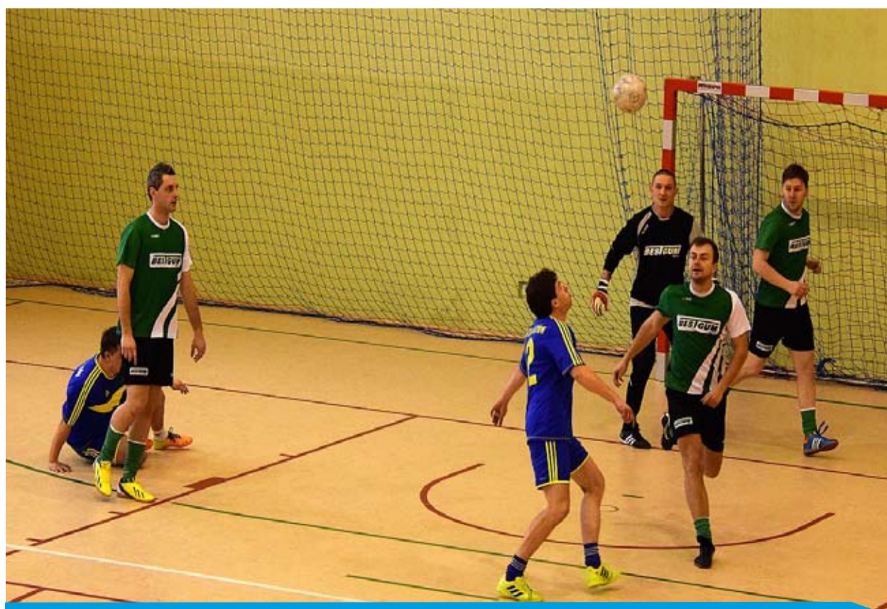
Dziewięć drużyn wystartowało w II Noworocznym Turnieju Samorządowców w Łękawie