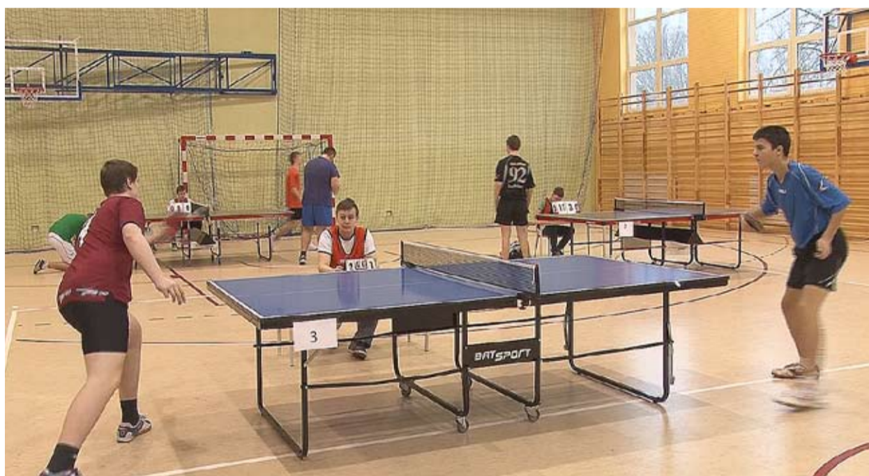
W hali sportowej w Łęce odbyły się Mistrzostwa Gminy Bełchatów w Tenisie Stołowym

Zgodnie z przewidywaniami turniej miał swoich faworytów, którzy nie zawiedli. Wyniki mistrzostw przedstawiają się następująco: