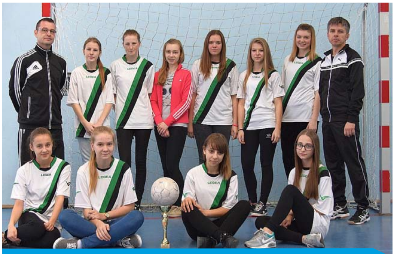
Reprezentacja Łękawy zajęła IV miejsce w Wojewódzkich Mistrzostwach Dziewcząt Szkół Gimnazjalnych w Halowej Piłce Nożnej