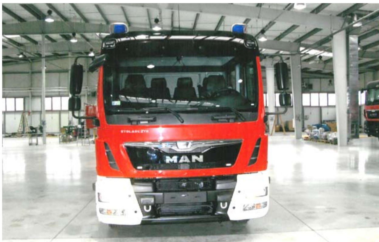
Nowy wóz pożarniczy prezentuje się znakomicie

4-drzwiową 6-osobową kabinę z napędem 4x2. Interwencja z zastosowaniem nowego samochodu pożarniczego pozwoli na ograniczenie skutków zdarzeń losowych i poważnych awarii zagrażających życiu i zdrowiu ludzkiemu oraz środowisku.