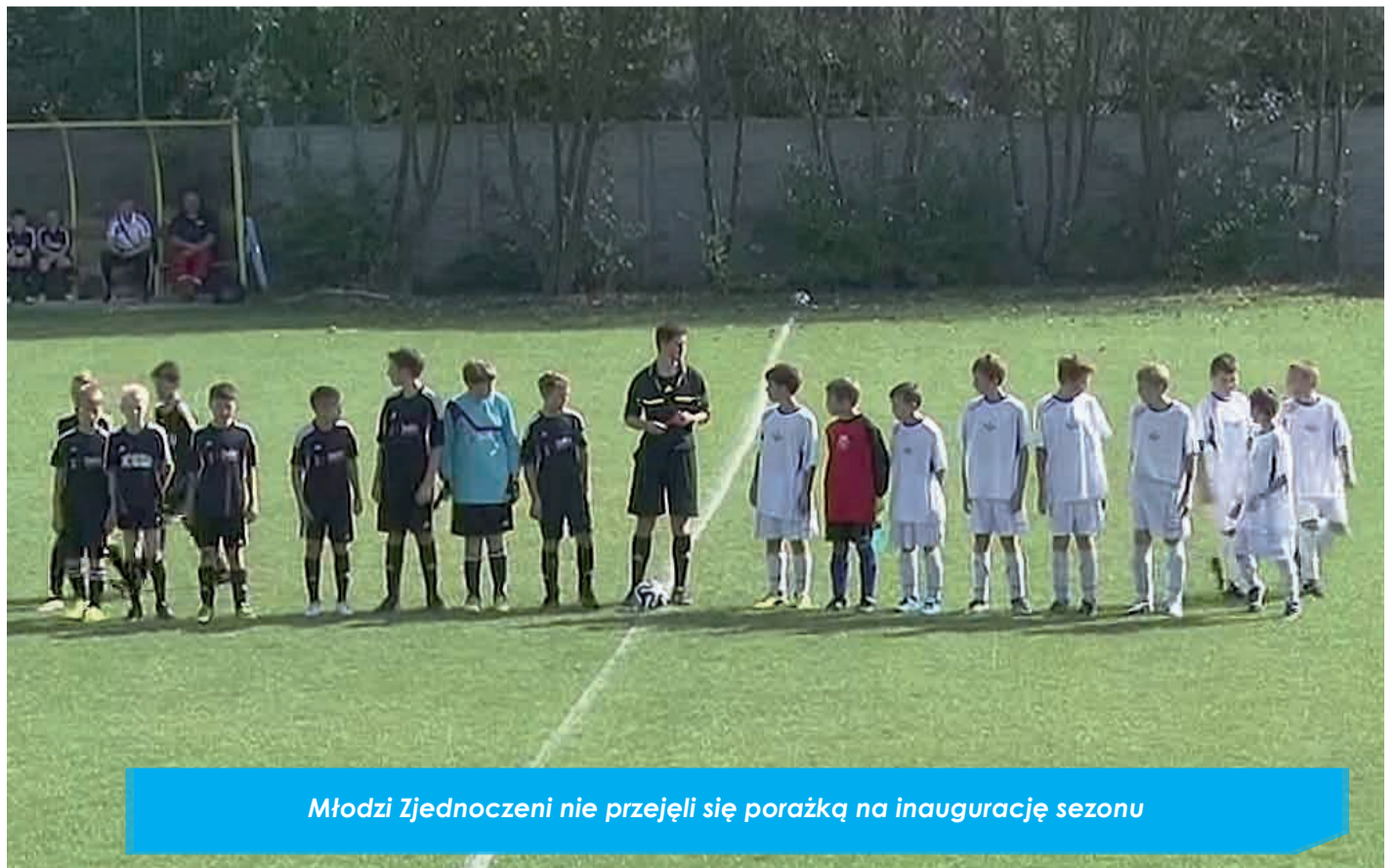
Młodzi Zjednoczeni nie przejęli się porażką na inaugurację sezonu

Przypomnijmy - swoje mecze Zjednoczeni rozgrywają w Emilinie, na obiekcie który cały czas jest modernizowany, a w przyszłości ma się stać Gminnym Centrum Sportu i Rekreacji. Zapraszamy do kibicowania, zarówno piłkarskiej młodzieży, jak i pierwszej drużynie Zjednoczonych przyda się gorący doping.