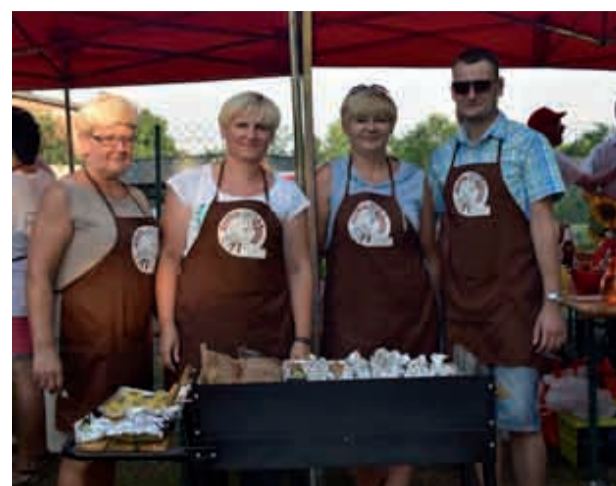
Podwody - to ta reprezentacja wygrała inaugurację Mistrzostw i finiszowała na 3 miejscu

Amatorów grillowania przepraszamy i życzymy powodzenia w kolejnej, przyszłorocznej edycji tej imprezy.