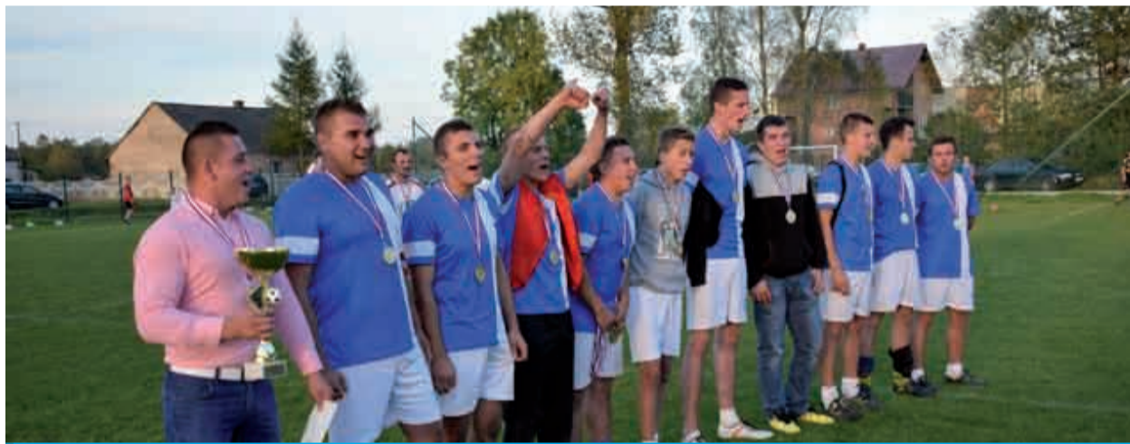
Puchar Przewodniczącej w tym roku trafia do Zawadowa