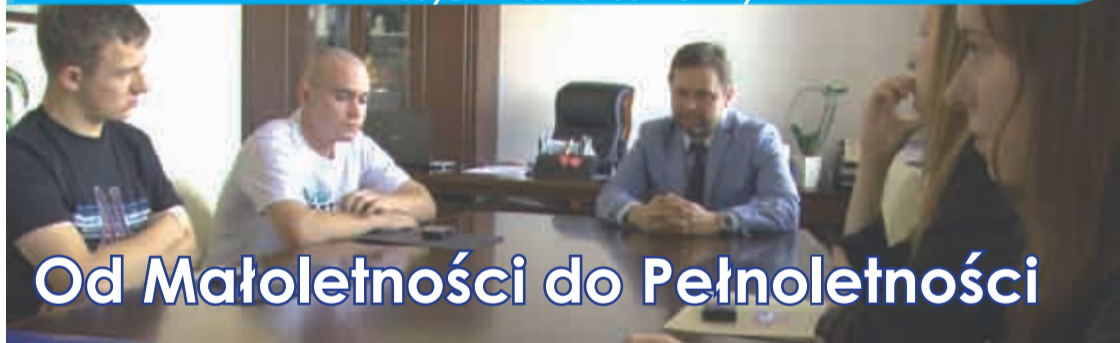
Spotkanie z 18-latkami było też okazją do poznania oczekiwań młodych mieszkańców Gminy

Ostatnie dni pokazały, że mieszkańcy Kałdun tworzą zgraną społeczność. Połączono tu przyjemne z pożytecznym – rocznica odnowienia kapliczki posłużyła za pretekst do sąsiedzkiego pikniku. Przy okazji nowego blasku dostała i sama kapliczka. Gratulujemy inicjatywy i czekamy na kolejne pomysły!