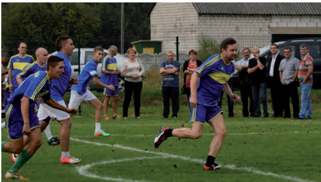
Tym razem Wójt bramki nie strzelił - reprezentacja UGB poległa 2-5