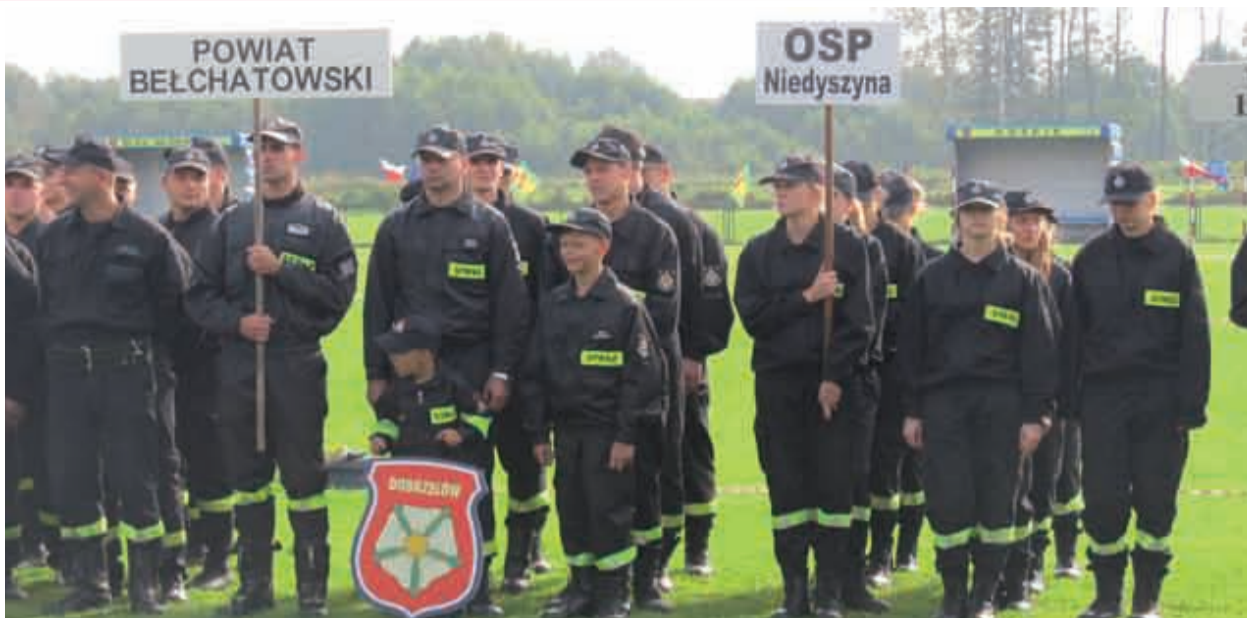
OSP Niedyszyna powtórzyła osiągnięcia z ostatnich zawodów wojewódzkich

Na łączny wynik zawodów składała się sztafeta pożarnicza 7x50m i ćwiczenie bojowe. OSP Niedyszyna uzyskała 141,41 pkt. i zajęła 10 miejsce (sztafeta 74,32 pkt., ćwiczenie bojowe 62,09 + 5 pkt. karnych = 67,09 pkt.) Z kolei OSP Dobrzelów zakończyła rywalizację na 12 miejscu, zdobywając 109,07 pkt. (sztafeta 58,11 pkt., ćwiczenie bojowe 35,96 + 15 pkt. karnych = 50,96 pkt.)