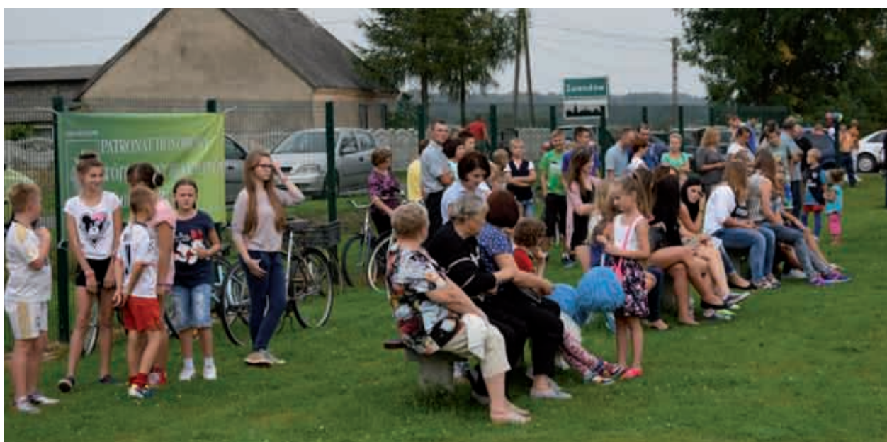
Grających dopingowała liczna grupa mieszkańców Zawadowa